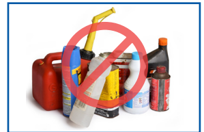
Recipientes que hayan contenido productos peligrosos