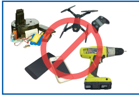
Aparatos electrónicos y pilas