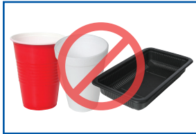
Plásticos #6 y negro