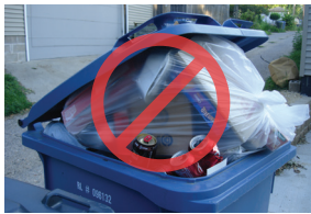
Reciclaje en bolsas