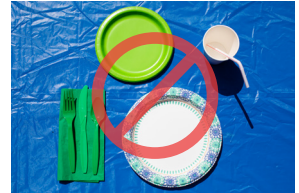
Platos, vasos, servilletas de papel, popotes/pajillas y utensilios