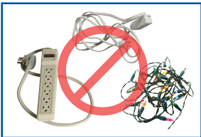
Elementos que se enreda, como cables eléctricos, luces navideñas y mangueras