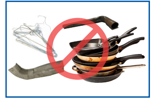
Artículos metálicos diversos