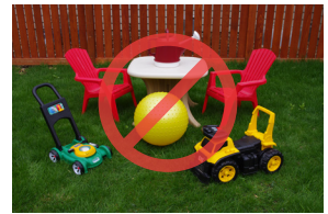
Artículos grandes de plástico y juguetes