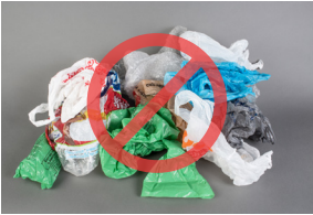
Bolsas y láminas de plástico

Los siguientes artículos causan problemas en el proceso de reciclado porque se enredan en los equipos, pueden dañar a los trabajadores y no tienen buenos mercados para convertirlos en materiales nuevos. Manténgalos fuera de su reciclaje. Más información en hennepin.us/recycling