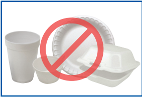
Espuma de plástico (Styrofoam™)