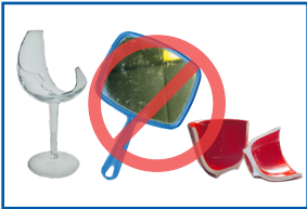
Platos de cristal, cristal de ventana y cerámica