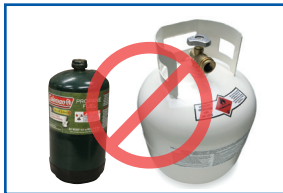
Cilindros presurizados (propano, helio, CO2)